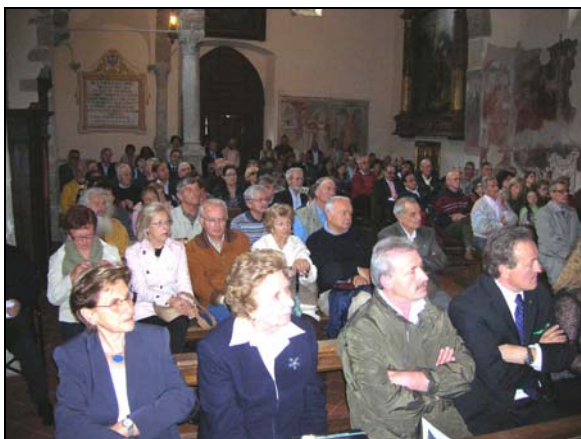
Presentazione del volume nella Chiesa di San Cornelio e Cipriano a Cornello

Il borgo si era intanto affollato: l'intera pagina Cultura dedicata all'avvenimento da L'Eco di Bergamo aveva portato centinaia di persone. La piccola chiesa era gremita, anche in piedi la gente non ci stava tutta e furono tenute aperte le porte per permettere anche a chi, costretto fuori, intendeva almeno cercare di sentire i vari interventi. “