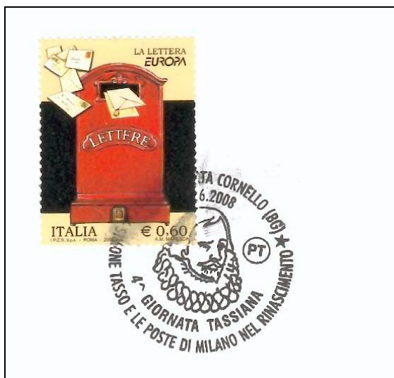
L'annullo speciale realizzato per la Quarta Giornata Tassiana

Durante la Quarta Giornata Tassiana, c'è stata anche l'Assemblea del direttivo dell'Associazione degli Amici del Museo dei Tasso e della Storia Postale, che da diverso tempo affianca e sostiene l'attività del Museo.